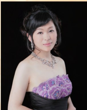
ソプラノ 田坂 蘭子